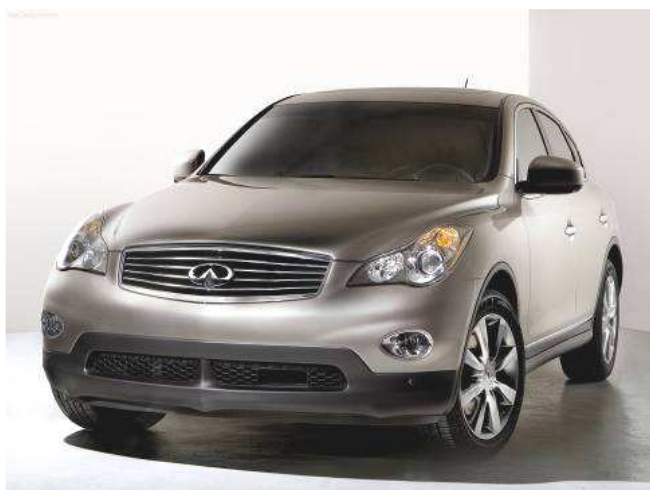
Фото автомобиля Infiniti EX35