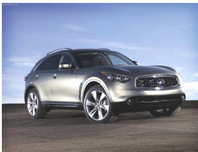
Фото автомобиля Infiniti FX50,FX35,FX37