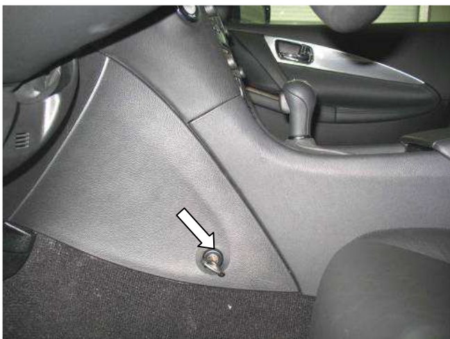
Фото №17 (Infiniti EX35)