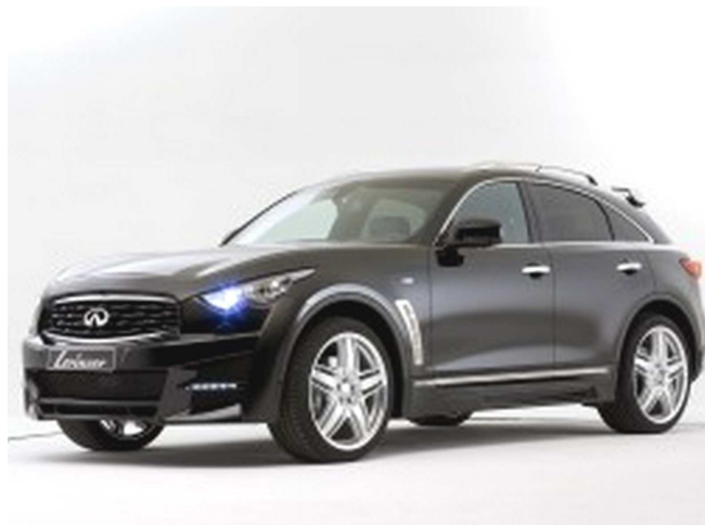
Фото автомобиля Infiniti FX30d