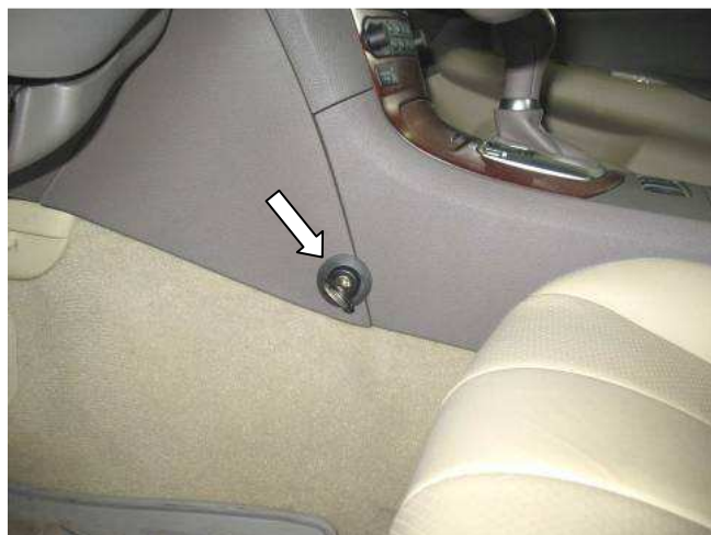
Фото №18 (Infiniti G35x, G37)