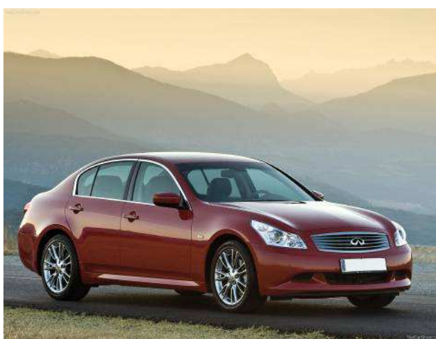
Фото автомобиля Infiniti G35x, G37