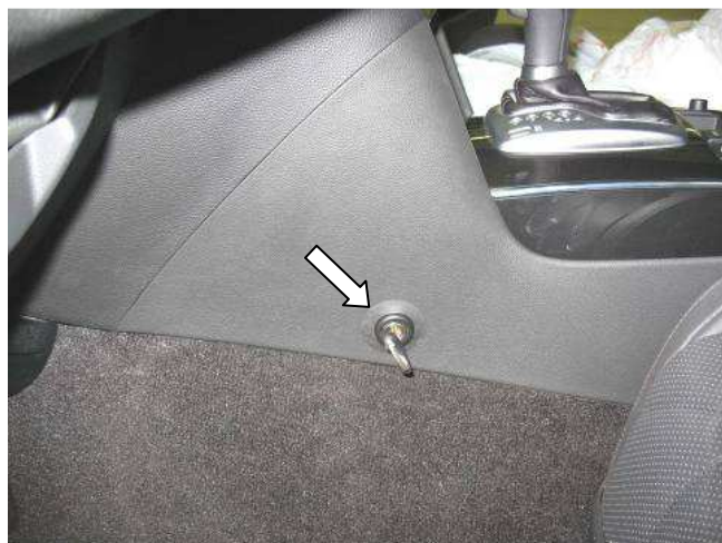
Фото №16 (Infiniti FX50, FX35, FX37)