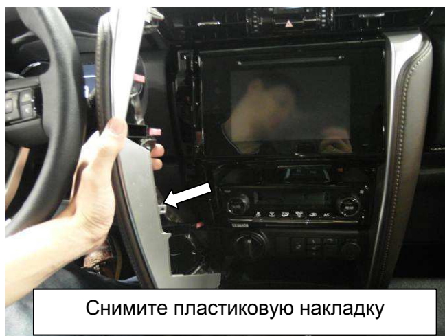
Снимите пластиковую накладку