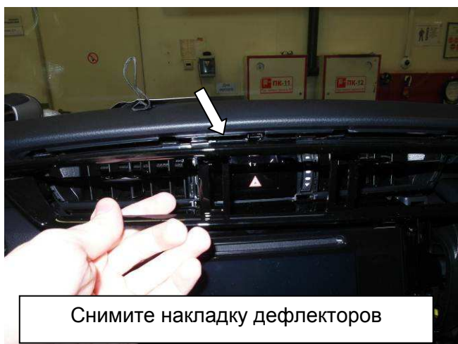
Снимите накладку дефлекторов