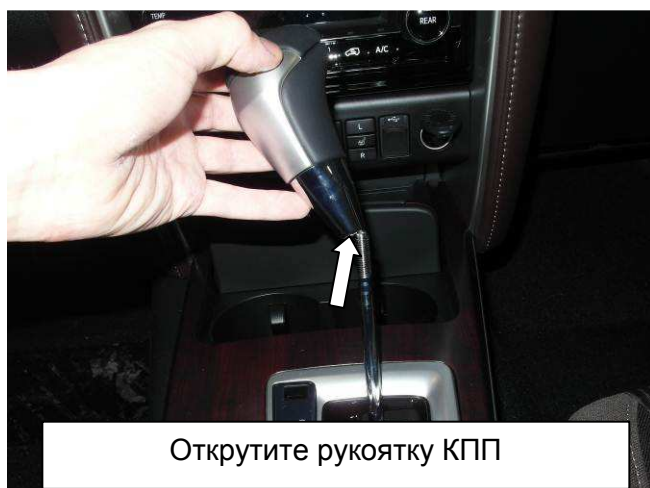
Открутите рукоятку КПП