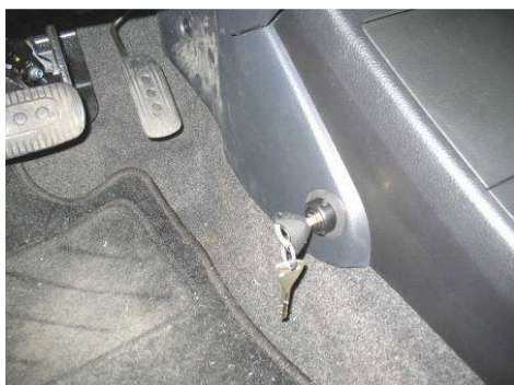
Φοτο №19 (NISSAN TIIDA)