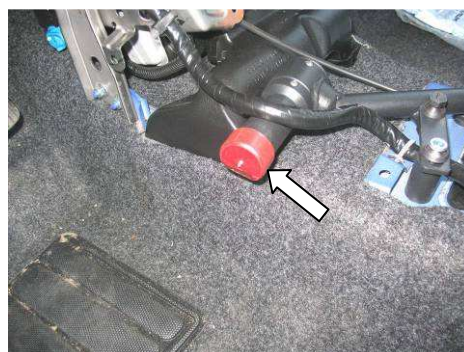
Фото №16 (NISSAN TIIDA)