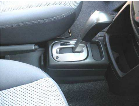
Φοτο Νο1 (NISSAN NOTE)