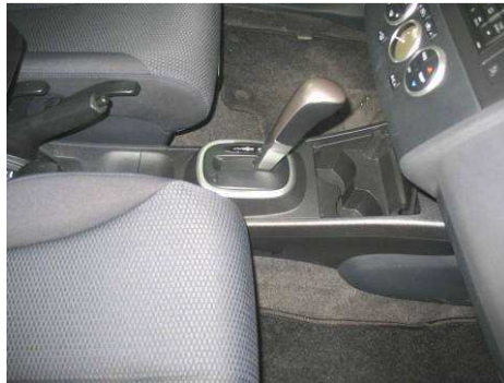
Φοτο Νο2 (NISSAN TIIDA)