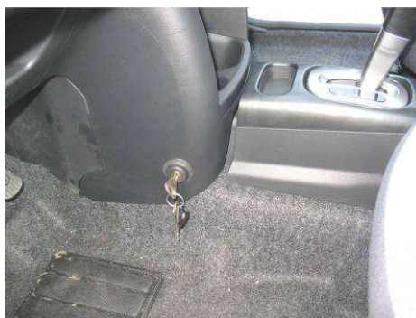
Φοτο №20 (NISSAN NOTE)