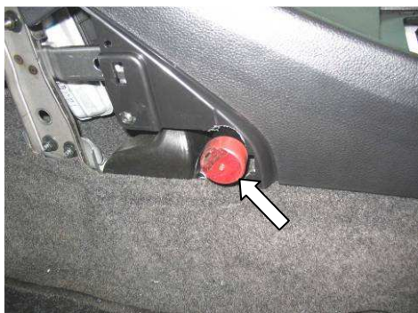
Φοτο №17 (NISSAN NOTE)