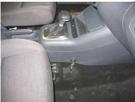
Φοτο Νο29 (VW GOLF PLUS)