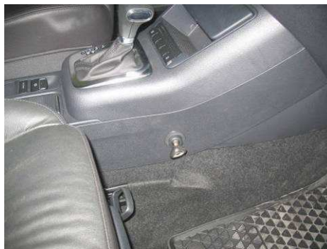
Φοτο Νο30 (VW TIGUAN)