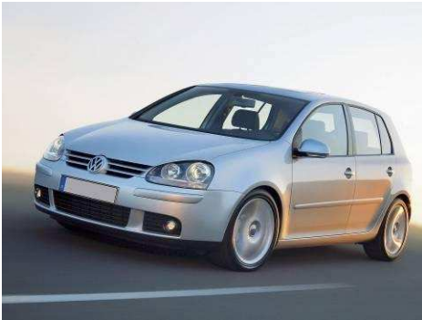
Автомобиль VW GOLF