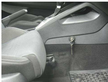
Φοτο Νο32 (VW SCIROCCO)