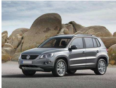
Автомобиль VW TIGUAN