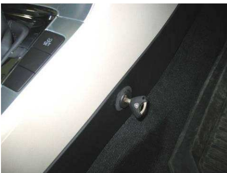
Φοτο Νο31 (VW PASSAT CC)