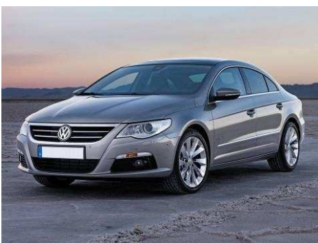
Автомобиль VW PASSAT CC