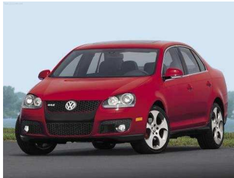
Автомобиль VW JETTA