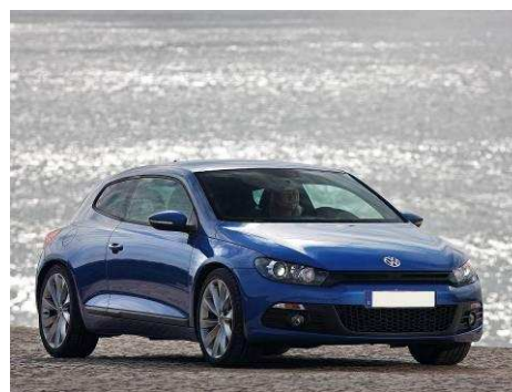
Автомобиль VW SCIROCCO