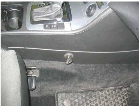
Φοτο Νο27 (VW PASSAT)