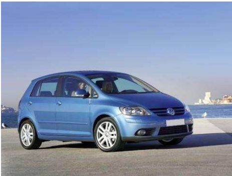
Автомобиль VW GOLF PLUS