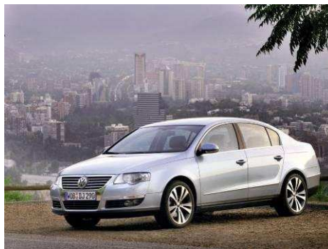
Автомобиль VW PASSAT B6