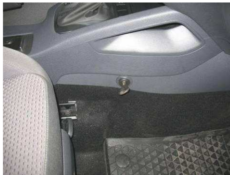
Φοτο Νο28 (VW GOLF, JETTA)