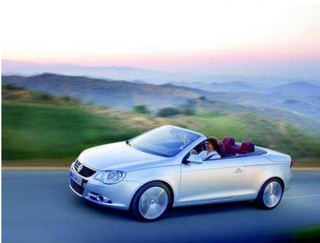
Автомобиль VW EOS